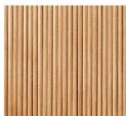
WAVE - INVISIBLE

Nos panneaux waves sont disponibles en une couleur: