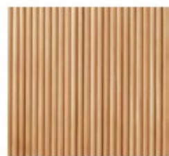
WAVE FLEX - INVISIBLE

Nos panneaux acoustiques sont disponibles en une couleur: