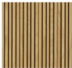
LINE FLEX - INVISIBLE

Nos panneaux acoustiques sont disponibles en une couleur: